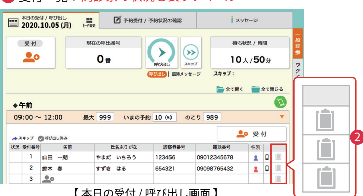
【本日の受付 / 呼び出し画面】